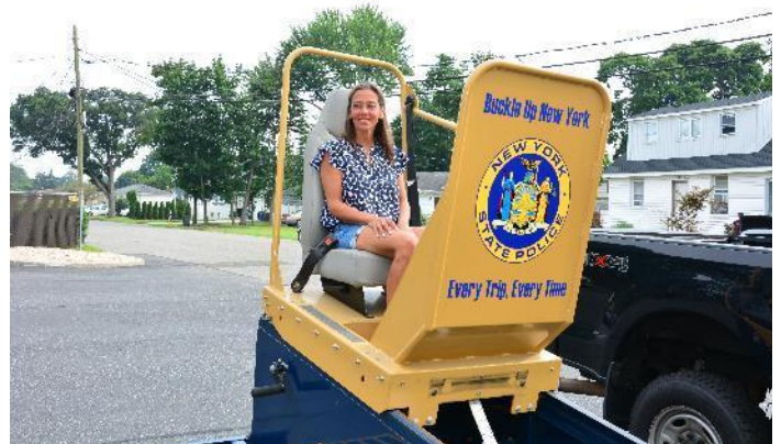
Durante el evento de Inspección de asientos infantiles, la senadora Mónica R. Martínez, presenció una prueba en el "Seat Belt Convincer", un sistema que permite que el pasajero experimente la fuerza real generada durante una colisión de 8 a 16 kilómetros por hora. (Click aquí para obtener la imagen en alta resolución).