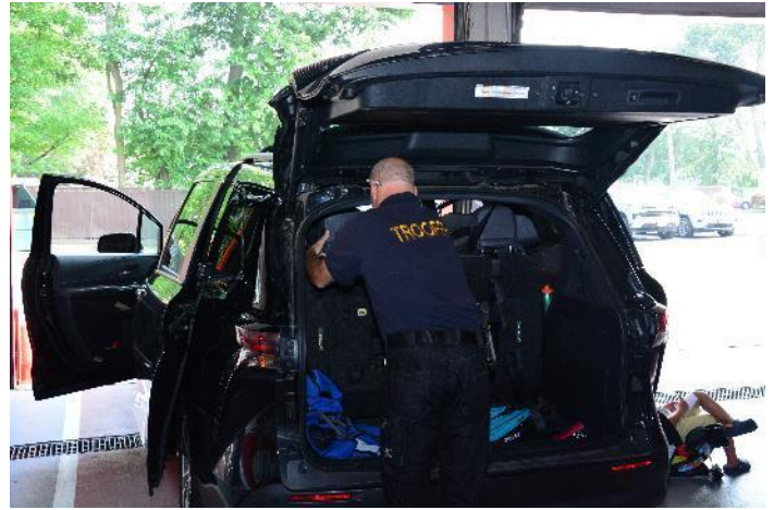
Durante el evento organizado por la senadora estatal Martínez el pasado 26 de julio, un policía estatal de Nueva York inspecciona un asiento infantil para asegurarse que este luego vaya instalado correctamente en el vehículo. (Click aquí para obtener la imagen en alta resolución).

En Estados Unidos, los accidentes automovilísticos continúan siendo una de las principales causas de muerte infantil. En 2023, un promedio de dos niños menores de 14 años fallecieron y 345 resultaron heridos en accidentes de tránsito mientras viajaban en vehículos como pasajeros.